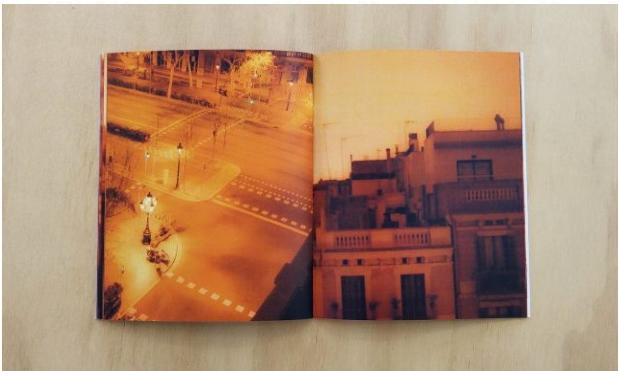
Marcel del Castillo: Round Trip, 2016

Por último una narración no sólo constituida en la crónica de esas existencias en encuentro fortuito, sino en la particular mirada cromática, saturada con las que el artista transforma esas imágenes en atmósferas volátiles, tal como se manifiesta en los espacios cromosaturados del artista venezolano Carlos Cruz Diez.