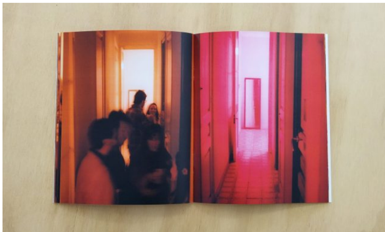
Marcel del Castillo: Round Trip , 2016