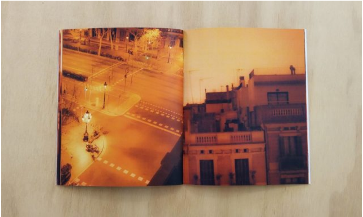
Marcel del Castillo: Round Trip, 2016

Por último una narración no sólo constituida en la crónica de esas existencias en encuentro fortuito, sino en la particular mirada cromática, saturada con las que el artista transforma esas imágenes en atmósferas volátiles, tal como se manifiesta en los espacios cromosaturados del artista venezolano Carlos Cruz Diez.