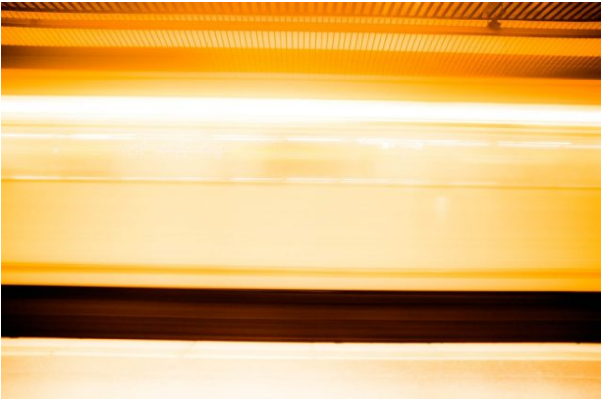
Marcel del Castillo: Round Trip, 2016

Marcel del Castillo, en su viaje circular hacia lo micro enlaza de manera consciente diversos cuerpos imaginales, los cuerpos que constituyen su hacer y sus estrategias de intérprete de una realidad cercana, realidad que se le presenta en su continuo deambular. Las urbes sus escenarios, las personas y sus relaciones sus sentidos, en