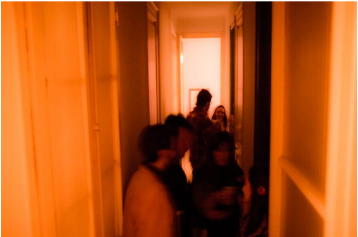
Marcel del Castillo: Round Trip, 2016

Round Trip narra su microhistoria de encuentros, de hallazgos personales en una gran urbe vista y captada desde abajo, en la mirada subjetiva del fotógrafo intérprete de ese abajo,