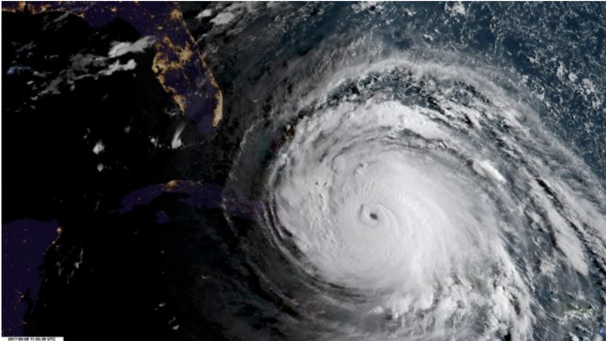
Imagen del satélite GOES-16 del viernes 8 de septiembre de 2017 del huracán Irma mientras avanza frente a Cuba hacia Florida.

El huracán Irma llegó esta madrugada a Cuba, con categoría 5, y sigue barriendo la costa norte de la isla avanzando del este al oeste. El ciclón golpeó cerca de Caibarién, en la provincia de Camagüey.